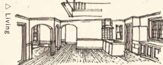
△ Living アーチの開口部や繊細な造作が優雅な雰囲気演出。ペットルームや岩盤浴スペースも完備され、癒しタイムも思いのまま。

南幌中央公園ののびやかな自然に隣接する、変化に富んだ三角屋根の佇まい。 北海道とよく似た気候を有する北米の伝統的な住宅様式を受け継ぐ、 堅牢にして美しいデザインの邸宅がここに完成いたしました。 一部2階建ての平屋を中心に、ダブルガレージを配した堂々たるフォルム。 歳月とともに風格を増す無垢の素材や、優美なディテールの細部など、 高気密・高断熱・省エネ性ほか、ハイスペックな基本性能と併せてご覧ください。