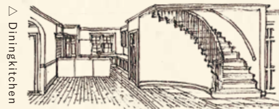
△ Diningkitchen 空間の見せ場となるサーキュラー階段は、幅や角度にもこだわって昇降しやすいデザインに。対面キッチンの奥はL型のカウンターがあり、作業も収納も快適。